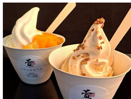
各種ソフトクリーム