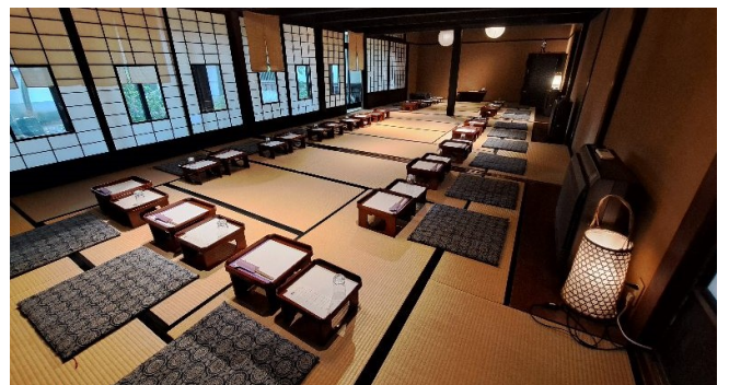
「蕎麦料理處萱」(奥座敷)