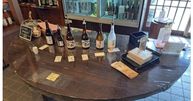
「売店 萱乃庵」(利き酒コーナー・無料)