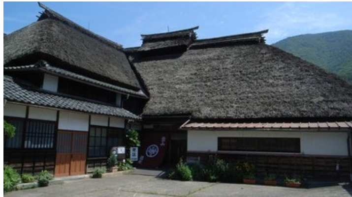
「蕎麦料理處萱」「売店 萱の庵」 店舗(母屋)