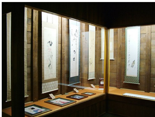
寛政蔵(竹久夢二館)