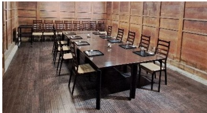
「蔵のイス席」 団体様オススメ(配蔵)