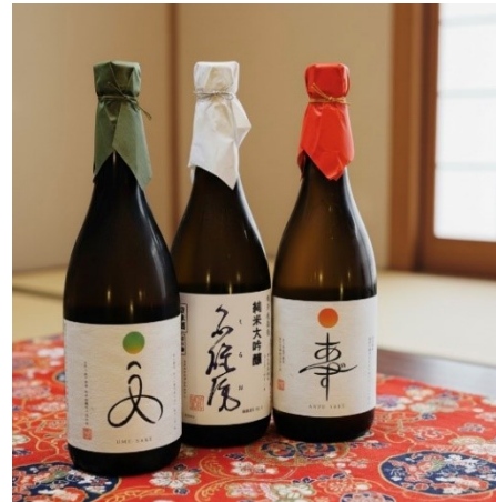
当蔵オリジナル酒