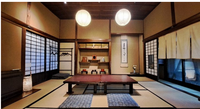
「蕎麦料理處萱」(奥の間 福寿像)