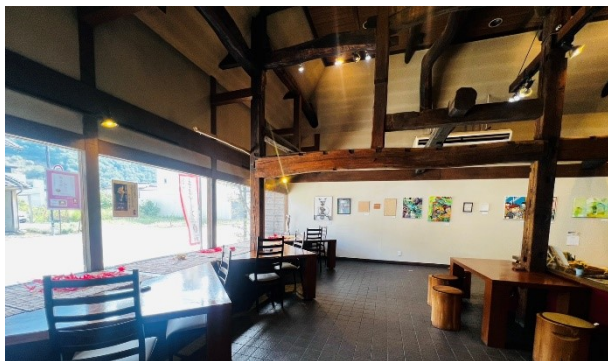
「売店 萱乃庵」(カフェ席)